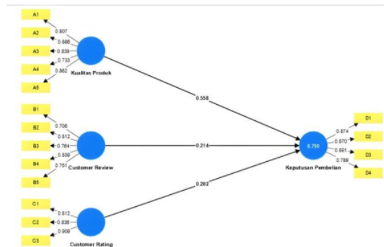
Gambar 3. Output Bootstrapping

Berdasarkan gambar diatas, adanya melakukan uji koefisien jalur. Uji koefisien jalur digunakan untuk melihat signifikansi pengaruh kualitas produk, online customer review dan customer rating terhadap keputusan pembelian dengan metode bootstrapping smartPLS. Pengujian koefisien jalur dilakukan dengan melihat besar nilai T statistic dengan T table signifikansi 5% yaitu sebesar 1,96. Dimana suatu hipotesis akan diterima bila memiliki T statistic lebih besar dari 1,96 dan suatu hipotesis akan ditolak apabila memiliki T statisti lebih kecil dari 1,96.