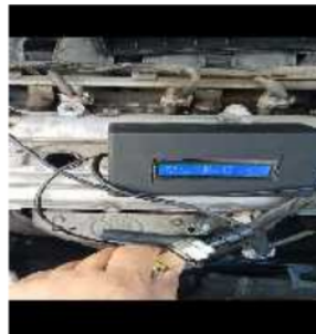
Gambar 9. Pengukuran Pada Mobil Suzuki Ertiga

Gambar 9. Merupakan pengambilan data dilakukan pada mobil suzuki ertiga, sensor suhu terletak pada tempat pengukuran oli mesin sementara sensor tekanan terletak pada tempat busi mobil, selanjutnya dilakukan pengukuran sebelum dan sesudah pemanasan mesin.