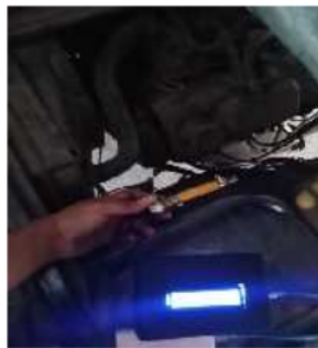
Gambar 7. Pengukuran Pada Mobil Suzuki Carry