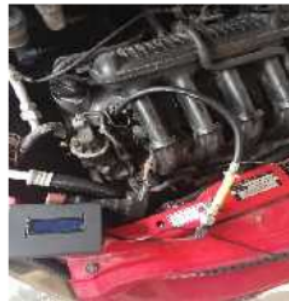
Gambar 8. Pengukuran Pada Mobil Honda Jazz

Gambar 8. Merupakan pengambilan data dilakukan pada mobil honda jazz, sensor suhu terletak pada tempat pengukuran oli mesin sementara sensor tekanan terletak pada tempat busi mobil, selanjutnya dilakukan pengukuran sebelum dan sesudah pemanasan mesin.