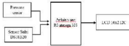
Gambar 1. Blok Diagram Sistem

Akan ada dua sensor yang akan terhubung dengan arduino yaitu sensor tekanan dan sensor suhu, dimana sensor tekanan akan di sambungkan ke tempat busi kendaraan yang berada di bagian silinder mesin sedangkan sensor suhu dipasang pada bagian tempat pengecekan ketinggian oli mesin kendaraan. Setelah di lakukan pengukuran hasil pengukuran akan di tampilkan pada LCD 16x2 I2C. Berikut merupakan blok diagram sistem yang digunakan pada Gambar 1.