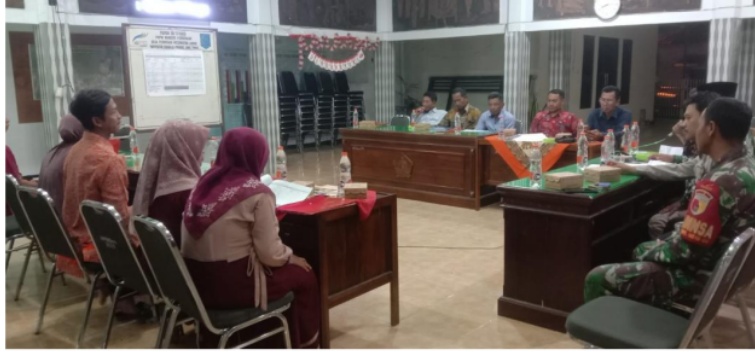
Gambar 2. Kegiatan Sosialisasi Aplikasi SIKS-NG Desa Permisan

Pada indikator integrasi dapat ditarik sebuah pemahaman bahwa dalam prosedur dirasa belum efektif karena minimnya pemantauan terhadap Operator SIKS-NG dalam melakukan program pemuktakhiran data di Desa Permisan oleh Dinas Terkait. Sedangkan sosialisasi pada stakeholder yang ada di Desa Permisan hanya dilakukan kurang dilakukan, hal tersebut dikarenakan hanya dilakukan satu kali kegiatan sosialisasi ketika awal penggunaan aplikasi SIKS-NG tersebut. Hal tersebut dikarenakan pihak Desa Permisan menganggap pembaharuan tersebut tidak berkaitan langsung dengan masyarakat miskin melainkan dengan operator yang mengoperasikan aplikasi SIKS-NG dilingkunagn Desa Permisan Kecamatan Jabon Kabupaten Sidoarjo.