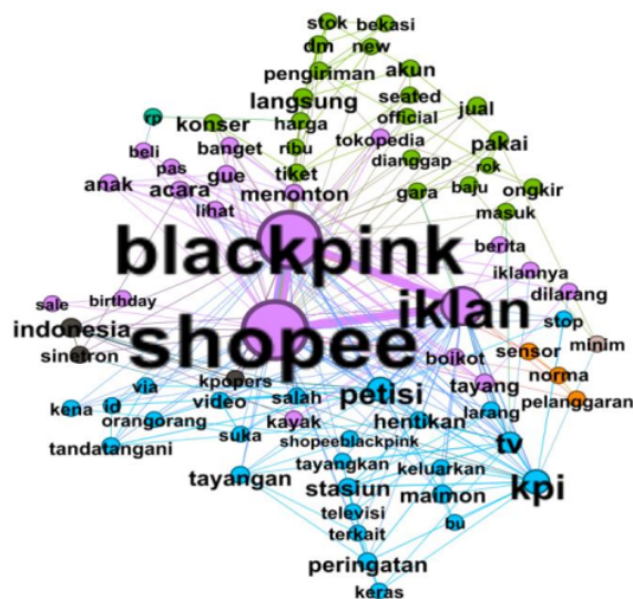
Gambar 2. Visualisasi Jaringan Untuk BlackPink 2018