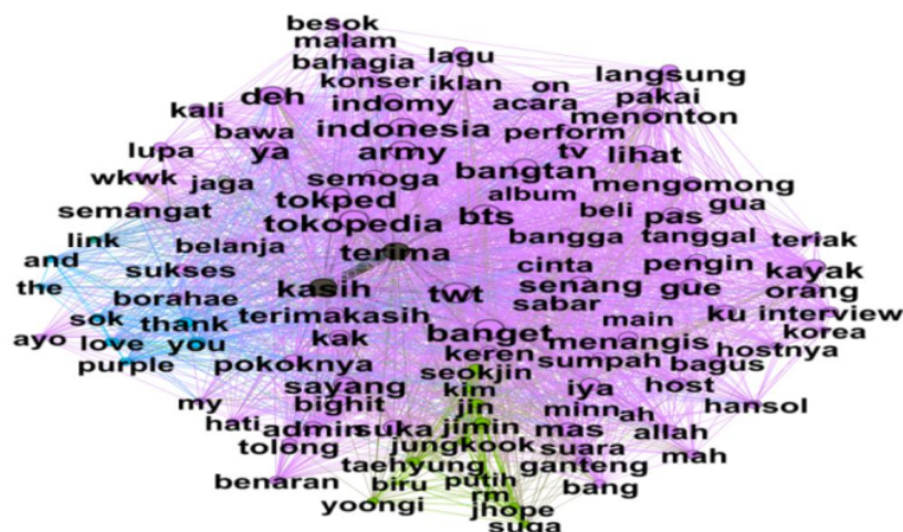
Gambar 4. Visualisasi Jaringan Untuk BTS 2019-2021

Sumber: Data yang telah diolah oleh penulis (2023)