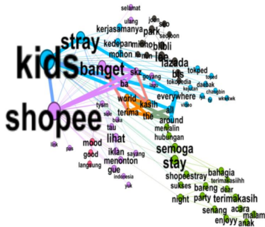
Gambar 3. Visualisasi Jaringan Untuk Stray Kids 2020

Tahap visualisasi pada gambar tersebut dikerjakan dengan tujuan untuk menghapus tweet yang tidak digunakan supaya dalam proses menganalisis mudah dikerjakan. Pada data stray kids tahun 2020 yang awalnya memiliki tweet sebanyak 1.500, setelah dilakukan proses filter dengan menggunakan wordij menjadi 77 tweet. Selanjutnya data tersebut akan di olah ke Gephi, yang mana telah didapatkan hasil model jaringan interaksi yang telah di filtering dengan menggunakan kata kunci “Stray Kids” dan didalam jejaringan tersebut diperoleh hasil kata yang sering muncul yaitu stray kids, shopee, terima kasih, ba (brand ambassador). Dapat dilihat bahwa didalam jejaring sosial tersebut sangat banyak yang membahas stray kids di Shopee serta memiliki ketertarikan tinggi dan membentuk kelompok yang menonjol. Keterlibatan pengguna satu sama lain tersebut, yang paling tinggi bisa dilihat di Gephi yang diidentifikasi dengan melihat visual jejaring sosial dimana mana graph yang dipilih adalah undirected graph (grafik yang tidak berarah).