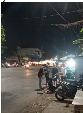
Gambar 1. Anak Jalanan di Perempatan Cepreh Kabupaten Sidoarjo

Dalam hal ini, Satpol PP Sidoarjo tidak dapat melakukan penjemputan sendiri. Mereka hanya dapat menyerahkan penjemputan kepada Dinas Sosial Sidoarjo, yang kemudian akan menilai anak jalanan dengan bantuan tim penjangkau. Dinas Sosial Sidoarjo tidak dapat menilai anak jalanan sendiri. Sekolah Menengah Islam (IPSM) Sidoarjo, Komunitas Taabah, Panti Asuhan Anak dan Remaja, Rumah Anak Indonesia, Rumah Singgah Yayasan Nurma, Rumah Singgah Anak Mandiri, Rumah Singgah dan Pendidikan Diponegoro, Yayasan Save Street Child, dan Yayasan Rumah Impian akan memperoleh manfaat dari anak-anak yang dinilai dalam kegiatan evaluasi. Mereka juga melakukan kegiatan penjangkauan bersama. Dalam hal ini, mereka saling membutuhkan satu sama lain, mulai dari penjangkauan teratur, rapat koordinasi teratur, penilaian, dan pengawasan anak. Mereka berkumpul secara teratur setiap dua minggu dan juga bergabung dalam kelompok media sosial untuk membahas masalah penanganan anak jalanan. Mereka segera memberi tahu orang lain tentang apa pun yang penting atau ditemukan terkait anak jalanan dan akan segera membahasnya untuk tindak lanjut.