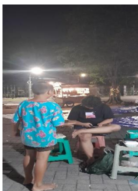
Gambar 2. Anak Jalanan di Alun-alun Kabupaten Sidoarjo

Dimulai dengan menyapa anak jalanan, menjangkau mereka, melakukan penilaian, berbicara tentang reunifikasi, dan berbicara tentang kasus konferensi, semua kegiatan dilakukan secara bersamaan. Ketika orang bekerja sama, mereka bergantung satu sama lain untuk bekerja sama untuk mencapai tujuan bersama dan mencapai konsensus