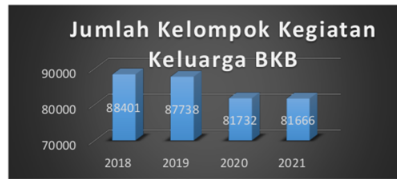
Grafik 1.1 Jumlah Kelompok Kegiatan Keluarga BKB di Indonesia