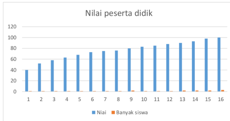
Gambar 2. Nilai peserta didik

Untuk langkah selanjutnya peneliti melakukan analisis deskriptif yang dimaksudkan untuk menuliskan hasil penelitiannya, untuk yang dilakukan ini, analisis statistik deskriptif terkait hasil nilai bagi peserta didik kelas IV-B Sekolah Dasar yang terlihat pada Tabel 1.