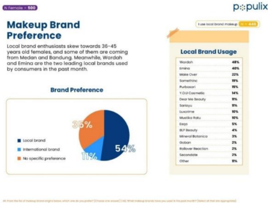
Gambar 1. Hasil Survei Populix [3]

Berdasarkan laporan hasil survei pada Agustus 2022 yang bertajuk “ Unveiling Indonesian Beauty & Dietary Lifestyle ” oleh Populix terhadap 500 perempuan yang tersebar di seluruh Indonesia. Survei tersebut membahas tentang penggunaan produk kecantikan dikalangan masyarakat Indonesia, sebanyak 54% perempuan Indonesia lebih memilih yang besar di Indonesia. Berdasarkan laporan hasil survei pada Agustus 2022 yang bertajuk “ Unveiling Indonesian Beauty & Dietary Lifestyle ” oleh Populix terhadap 500 perempuan yang tersebar di seluruh Indonesia. Survei tersebut membahas tentang penggunaan produk kecantikan dikalangan masyarakat Indonesia, sebanyak 54% perempuan Indonesia lebih memilih brand lokal, 11% responden memilih brand internasional dan 35% responden tidak memiliki preferensi terhadap asal brand [3].