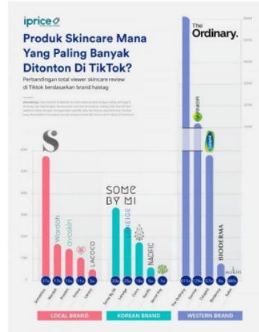
Gambar 1 Peringkat Produk Perawatan Wajah Pada Aplikasi TT

Dengan cepatnya perkembangan media sosial pada saat ini, mengakibatkan banyak sekali penjual yang mempunyai brand ternama menjadikan aplikasi sebagai tempat perbelanjaan, produk perawatan wajah Somethinc yang setiap hari memanfaatkan fitur dari Aplikasi TikTok untuk mencuri perhatian customer dan para calon konsumen. Dimana produk perawatan wajah ini merupakan beauty brand lokal yang paling diminati di aplikasi TikTok. Tidak hanya mengeluarkan produk makeup , Produk Somethinc ini juga meluncurkan produk untuk perawatan wajah khususnya untuk kulit wajah orang Indonesia. Dengan keunggulannya yang sudah memiliki label halal dan pastinya harga yang sangat affordable membuat para wanita terpicat untuk memilih produk Somethinc sebagai perawatan pada wajahnya. Tidak hanya itu, produk Somethinc ini juga sudah ber BPOM sehingga sangat aman apabila digunakan. Para calon konsumen akan banyak sekali berpikir dalam melakukan pembelian secara online dikarenakan mereka mendapatkan informasi mengenai barang yang hendak mereka beli dengan hanya melihat berita atau review dari banyaknya orang [3].