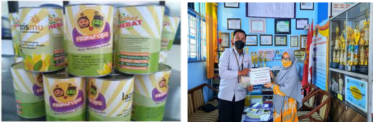
Gambar 1. Kaleng filantropi cilik LAZISMU

Kaleng filantropi cilik ini merupakan sebuah tempat yang berbentuk tabung dan memiliki panjang sekitar 14 cm yang mana dibagian atasnya terdapat lubang kecil untuk memasukkan uang kertas ataupun koin dan bagian bawah terdapat pengunci kaleng yang dapat dibuka. Tujuannya agar siswa mudah mengambil hasil uang yang terkumpul dan menghitungnya sehingga kaleng juga tidak perlu dipecah maupun dipotong dan dapat dipakai kembali. Untuk bagian sisi kaleng filantropi cilik terdapat tulisan logo LAZISMU, alamat LAZISMU dan kata mutiara mengenai amal saleh.