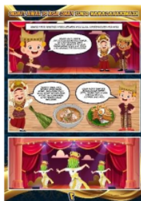
Gambar 2. Isi komik