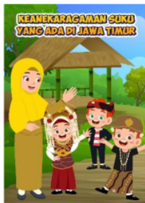
Gambar 1. Cover komik

Pada tahapan merancang produk ini peneliti mulai merancang media pembelajaran yang berupa buku komik, Adapun Langkah-langkah perancangan produk media pembelajaran komik, pertama penyusunan kerangka komik, kedua menentukan desain atau fitur pada komik. Dalam pembuatan komik ini peneliti menggunakan aplikasi Clip studio paint yang dikombinasikan dengan aplikasi Canva. Berikut gambar desain komik.