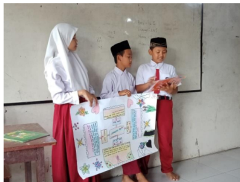
Gambar 1. Diskusi siswa kelas 5 SDS Hidayatul Muftadi'en

Hasil analisis tabel 2 sesuai dengan penelitian yang telah dilakukan (Kalsum Nasution, 2017) dan penelitian yang telah dilakukan (Yuwanita et al., 2020) menunjukkan bahwa metode pembelajaran memiliki pengaruh terhadap pemahaman siswa di sekolah. Pemilihan dan penggunaan metode pembelajaran yang tepat akan memiliki pengaruh yang kuat maupun sedang terhadap hasil belajar siswa di sekolah, karena setiap metode pembelajaran memiliki keunggulan dan peranan masing-masing jika digunakan dan disesuaikan dengan kondisi serta kebutuhan siswa di dalam kelas. Salah satu contoh yang ada pada gambar 1 menunjukkan bahwa pemilihan metode pembelajaran yang tepat dapat membantu siswa lebih aktif sekaligus membantu pemahaman mereka tentang materi pembelajaran yang diajarkan di dalam kelas.