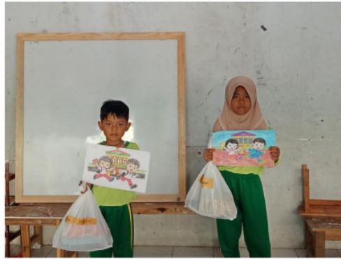
Gambar 2. Kegiatan lomba siswa SDS Hidayatul Muftadi'en