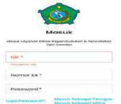
Gambar 1. Tangkapan Layar Website Plavon

Pemerintah Desa Larangan Kabupaten Sidoarjo dalam mengurus surat-surat apapun, termasuk pembuatan KTP, Kartu Keluarga, Akte Kelahiran, Kia, dan surat cerai dan kematian, Surat pindah masuk, surat pindah keluar. semua staf di kelurahan desa larangan memiliki akun Plavon jika pada saat memproses dokumen tidak ada pemberitahuan bahwa dokumen tersebut telah selesai dan diberitahukan melalui email pembuat surat dokumen itu maka penanggung jawab administrasi memeriksa dokumen tersebut apakah sesuai dengan persyaratan yang ditentukan dari pihak Dukcapil atau tidak sesuai dengan persyaratan yang diinginkan oleh Dukcapil jika tidak memenuhi persyaratan yang diinginkan dapat dilihat dokumen apa yang belum sesuai dengan persyaratan yang diinginkan. layanan via online ini dirasakan sangat membantu dalam proses pembuatan dokumen kependudukan, baik pembuatan surat maupun pengarsipan surat selain itu masyarakat juga sangat terbantu dalam pembuatan dokumen kependudukan secara mandiri melalui smartphone dan komputer tanpa harus datang ke Kantor Kelurahan setempat pelayanan via online ini mulai diterapkan di Pemerintah Desa Larangan pada tanggal 27 oktober 2021 sumber: https://disdukcapil.sidoarjo.go.id/ di jelaskan dalam (Peraturan menteri RI No 07 tahun 2019 tentang pelayanan kependudukan)[6].