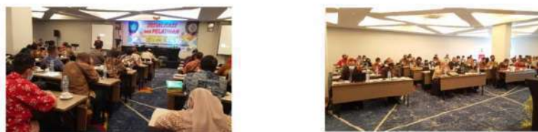
Gambar 3 sosialisasi dan pelatihan pelayanan Masyarakat publik berbasis online tahun 2021 Tabel 3 jumlah peserta sosialisasi dan pelatihan pelayanan masyarakat publik berbasis online

Kebijakan public dapat dilakukan dengan baik akan menjadi efektif jika terjadi komunikasi yang baik antara pelaksana kebijakan dan pemangku kepentingan. Program tersebut perlu di sampaikan dengan baik agar pelaku sasaran dapat memahami serta mengetahui tujuan dari program tersebut. Terkait penyampaian pelaksanaan program website Plavon ini di Pemerintah Desa Larangan dilakukan oleh kepala Desa, dari pihak Dukcapil, Dari pemerintah Kabupaten juga tentunya beserta staff Pemerintah Desa Larangan lainnya. Sosialisasi ini dilakukan untuk menyalurkan informasi dan juga pelatihan pelayanan masyarakat berbasis online yang disampaikan secara langsung di Hotel Luminor pada tanggal 20 oktober 2021 pada jam 09.00-16.00, dan jumlah peserta yang mengikuti sosialisasi tersebut berjumlah 100 orang.