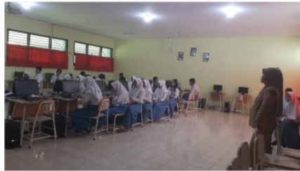
Gambar 3. Proses Kegiatan Belajar Mengajar Berbasis TIK