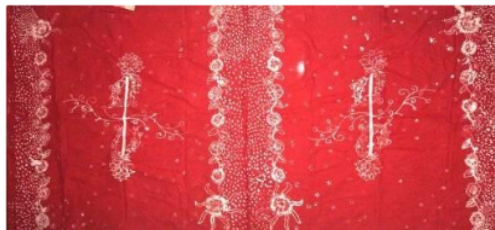
Gambar 2. Hasil Karya Kreatifitas Peserta didik