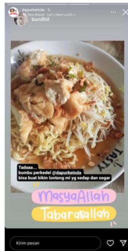
Gambar 6. Repost Testimoni Customer

Yang ketiga keunikan merek , Dapur Keinda secara tidak langsung memberikan inovasi bagi para customer yang menyukai hal instant contohnya pada feeds Instagramnya banyak sekali tips memasak dengan mudah. Untuk keunikan pada produknya sendiri, Dapur Keinda memiliki banyak varian bumbu. Namun mereka juga terkadang memberi inovasi misal, bumbu soto Betawi diolah menjadi masakan lain menjadi Mie Udon. “Aku harus menguasai bumbu, aku tau value bumbu. Jadi kalau aku belajar, itu namanya blue ocean. Meriset merk lain yang aku coba mulai dari harganya, strategi tempat dan harus tau value kompetitor, tapi seenggaknya kita punya uniq selling. Pembedanya kita harus menciptakan itu, yang penting ngangenin”. Dan terbukti dari inovasi yang diberikan ternyata mendapat respon baik juga dari customer, seperti bumbu perkedel diolah menjadi lontong mie.