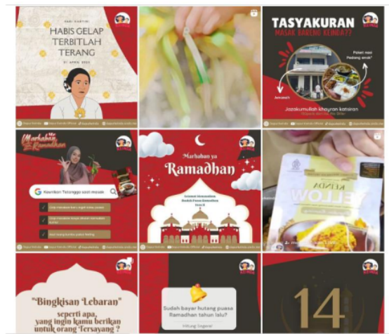
Gambar 4. Feeds Instagram Dapur Keinda

Tidak hanya dari unggahan infografis feeds Instagram dan Caption namun dalam menentukan warna desain tersebut juga dipikirkan oleh owner dari Dapur Keinda memang memilih warna merah sebagai dominan untuk infografis dalam unggahannya, agar dapat menjadi ciri khas Dapur Keinda agar nyaman untuk dilihat. Namun saat ini, Instagram telah memiliki banyak fitur yang dimana pengguna Instagram diharapkan dapat mengikuti adanya pembaruan tersebut. Seperti yang dialami Owner Dapur Keinda “Yang aku pelajari sekarang itu tadinya kalau di Instagram cuma update rutin feeds tanpa mikirin reels, ternyata viewers terbesar berasal dari reels. Akhirnya aku belajar bikin konten ala kadarnya tapi akhirnya naikin penjualan juga di e-commers. Kalau di Instagarm naikin engagement lebih banyak giveaway, interaksi kayak mitos atau fakta, lebih banyak ngasih edukasi dan aku pilih tipe soft selling”.