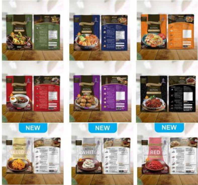
Gambar 2. Varian Bumbu Dapur Keinda