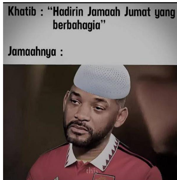
Gambar 5. Meme Ketiga

Semua meme ini memiliki bentuk yang kira-kira sama seperti dalam gambar, komik berbentuk persegi atau persegi panjang. Namun, ada beberapa gambar digabung menjadi satu lalu beri keterangan tentang gambar yang ada di dalamnya. Ada juga gambar sendiri dengan tambahan komentar satir, serta gambar diubah menjadi komik dengan tulisan seperti halaman buku komik.