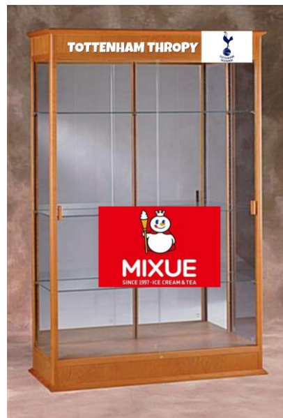
Gambar 3. Meme Pertama

Admin pada akun @memefess memberi peringatan dalam bentuk tulisan yang di pin sebagai peringatan dibuat dengan tujuan orang yang mudah tersinggung menyarankan untuk tidak mengikuti akun @memefess.