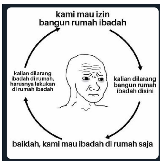
Gambar 4. Meme Kedua

Meme kedua adalah gambar satir tentang pelanggaran ibadah natal di rumah penganut agama Kristen oleh warga Cilebut, Bogor. Kreator membuat dalam bentuk komik yang menggambarkan kejadian sering terulang. Dalam gambar itu komentarnya "Kalian dilarang bangun rumah ibadah disini" dan "kalian dilarang ibadah di rumah, harusnya lakukan di rumah ibadah" merupakan sindiran terhadap warga yang melarang mereka beribadah.