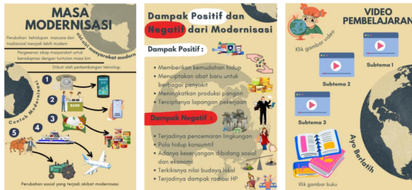
Gambar 2. Media Poster Digital Tentang Masa Modernisasi

Langkah berikutnya yang perlu diperhatikan adalah terkait kelayakannya terhadap media pembelajaran Poster Digital . Proses penilaian ini disebut uji validasi oleh ahli di bidangnya yang akan melalui tahap penilaian oleh para ahli untuk menentukan sejauh mana kelayakannya produk tersebut dalam kegiatan pembelajaran. peneliti melakukan validasi kepada ahli media dan ahli materi yaitu dengan dosen PGSD UMSIDA untuk mengetahui kevalidan produk. Selama pengembangan media poster digital mendapat beberapa masukan revisi dari ahli media dan ahli materi. Revisi tersebut bertujuan untuk menyempurnakan produk yang akan dihasilkan. Berikut adalah penilaian keseluruhan setiap aspek yang dinilai dari semua validator.