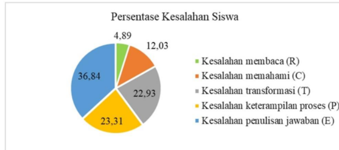
Gambar 3. Persentase kesalahan yang dilakukan oleh siswa

Berikut adalah persentase rekapitulasi kesalahan siswa dalam menyelesaikan soal AKM Kelas numerasi berdasarkan prosedur NEA yang disajikan dalam gambar 3.