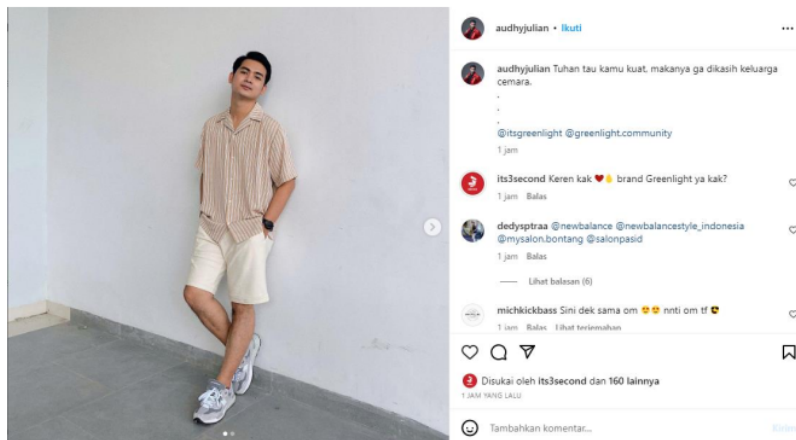
Gambar 5. Postingan akun @audhyjulan yang ditanggapi dan di like oleh akun @3second