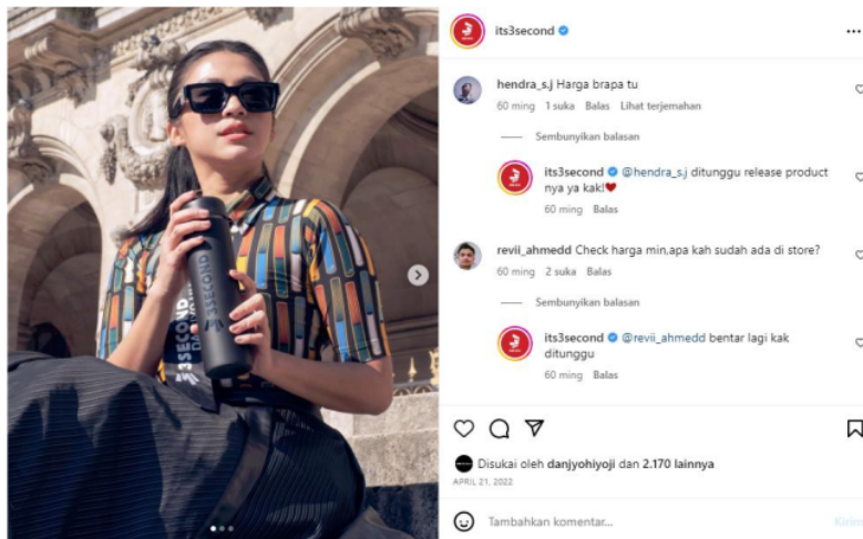
Gambar 4. Postingan konten bulan April 2022 akun @3second menanggapi komentar konsumen

Selain itu, @3second juga mendorong konsumen untuk terlibat dengan konten yang mereka bagikan di Instagram. Brand yang satu ini kerap mengajak konsumen untuk membagikan foto dirinya menggunakan produk @3second menggunakan hashtag brand atau men-tag akun brand tersebut. Merek tersebut kemudian membagikan beberapa foto konsumen ini di akunnya, membawa pengakuan dan menciptakan hubungan yang lebih dekat dengan konsumen. Berikut postingan akun @3second dalam berinteraksi kepada konsumen melalui komentar postingan, dan merek memberikan interaksi terhadap posting konsumen yang menandai akun @3second.