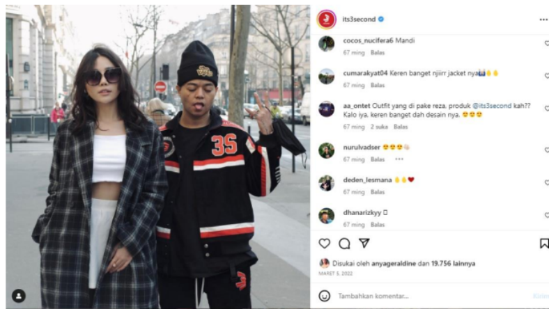
Gambar 2. Postingan konten bulan Maret 2022 Kualitas produk dari akun @3second serta tanggapan konsumen

@3second dikenal karena menghadirkan produk-produk dengan kualitas yang baik, yang meliputi pemilihan bahan yang berkualitas, desain yang menarik, dan detail yang teliti. Merek ini mengutamakan kualitas dalam setiap tahap produksi untuk memastikan bahwa produk yang dihasilkan memenuhi standar yang tinggi. Bahan yang digunakan pun dipilih dengan cermat, dengan mengedepankan kenyamanan dan tahan lama, sehingga konsumen dapat merasakan kualitas yang baik saat mengenakan produk mereka, bahkan konsumen selalu tertarik akan produk baru yang di launching oleh 3second. Berikut postingan yang di upload bulan maret tahun 2022 lalu oleh @3second sudah banyak memiliki like, dan juga komentar mereka yang menyukai produk dari merek ini, lalu menggunakan talent beberapa artis/brand ambassador untuk menaikkan traffic yang signifikan.