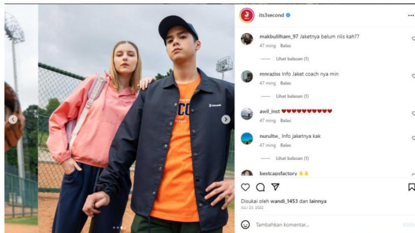
Gambar 8. Postingan bulan Juli 2022 akun @3second dengan komentar konsumen, tanda citra merek sudah terbentuk

Selain itu, komentar yang muncul di bawah postingan merek juga dapat mempengaruhi citra merek. Tanggapan merek terhadap umpan balik pengguna, baik itu pertanyaan, pujian, atau beberapa masukan, mencerminkan sikap merek terhadap konsumen. Respons yang ramah, responsif, dapat membantu meningkatkan