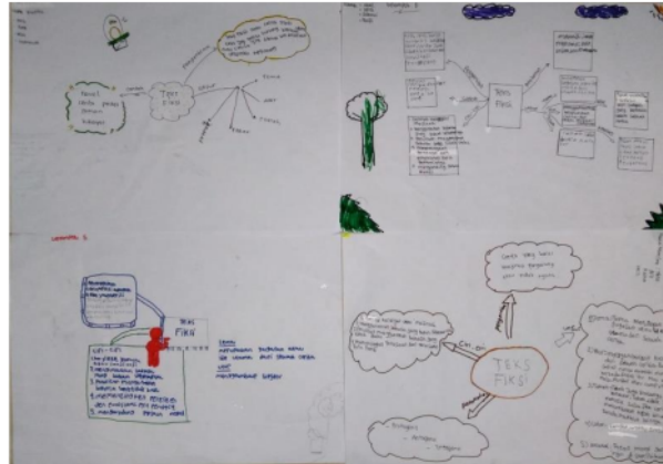
Gambar 1. Hasil Mind Mapping Peserta didik