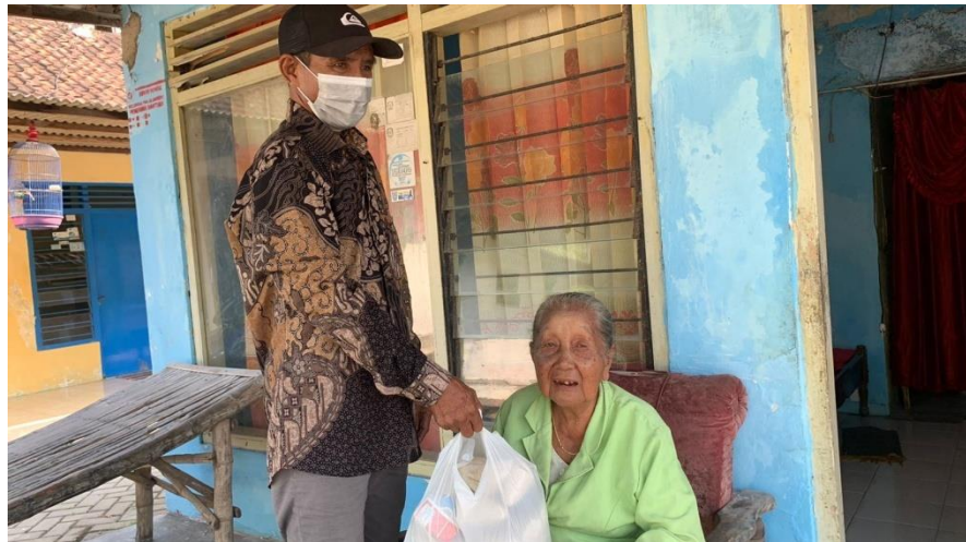
Gambar 3. Pendistribusian Bantuan Sembako

Selain foto pada saat proses distribusi paket sembako terdampak Covid-19. Di Desa Wunut Kecamatan Porong juga membuat tanda terima paket sembako terdampak Covid-19 dengan meminta tanda tangan kepada warga penerima bantuan sebagai bentuk pemantauan program yang dijalankan agar tepat sesuai dengan sasaran yang telah ditentukan. Kemudian bukti tanda tangan tersebut nantinya akan diserahkan kepada pihak pemerintah desa dan akan dikirimkan kepada pemerintah pusat oleh pihak Desa sebagai bukti bahwa bantuan telah didistribusikan.