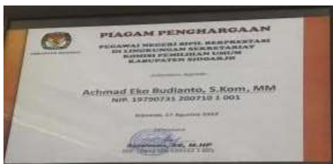
Gambar 2. Piagam Penghargaan

Menurut data, hasil dari proses kompleks kerja pegawai Sekretariat KPU Kabupaten Sidoarjo baik faktor internal (internal factor) maupun rencana strategis organisasi. Selain itu faktor eksternal seperti lingkungan fisik dan non fisik, faktor internal seperti motivasi, tujuan, dan nilai juga dapat berdampak negatif terhadap kinerja. Faktor-faktor tersebut di atas sangat mempengaruhi kualitas kerja pegawai KPU Kabupaten Sidoarjo. Kualitas kerja selalu dianggap penting oleh pegawai KPU Kabupaten Sidoarjo. Hal ini didasari pemikiran agar kualitas pekerjaan yang dilakukan di KPU Kabupaten Sidoarjo relatif lebih baik dibandingkan KPU pusat. Kualitas ketenagakerjaan pegawai KPU Kabupaten Sidoarjo merupakan metrik yang dapat ditentukan oleh proses atau hasil suatu proyek, dalam format yang dapat mengakomodir kebutuhannya. Hasil peneliti menunjukkan bahwa adanya 1 pegawai dari jumlah keseluruhan ASN berjumlah 14 orang yang mendapatkan piagam penghargaan kategori pegawai negeri sipil berprestasi di lingkungan sekretariat Komisi Pemilihan Umum (KPU) Sidoarjo dengan nama terang Achmad Eko Budianto, S.Kom, MM, [18]. Menurut Hasibuan (2013:53) Kompetensi Suatu kemampuan untuk melaksanakan atau melakukan suatu pekerjaan atau tugas yang dilandasi atas keterampilan dan pengetahuan dapat dilihat melalui gambar 2. Piagam Penghargaan Berikut ini :