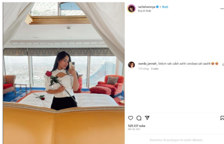
Gambar 2. Instagram Rachel Venny

Keputusan Rachel Venny untuk melepas hijabnya membuat para penggemar dan netizen terkejut sekaligus kecewa. Rachel Venny dikenal oleh netizen karena cara mendidik anak dan sudah menjadi public figure sekaligus role model dari berbagai kalangan. Ketika ia membagikan postingan mengenai keputusannya melepas hijab menjadikan penggemarnya mengungkapkan rasa kecewa melalui kolom komentar Instagramnya, bahkan komentar negatif. Pesan Verbal yang diungkapkan oleh oleh pengguna instagram lainnya merupakan penghinaan yang ditujukan untuk Rachel Venny.