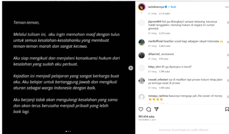
Gambar 4. Instagram Rachel Venny 2