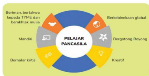
Gambar 1 Enam Dimensi Profil Pelajar Pancasila

Profil pelajar Pancasila ini bisa digunakan dalam menunjukkan kepentingan karakter dan kompetensi yang diharapkan terutama bagi guru serta peserta didik. sebagai pegangan dalam melaksanakan pembelajaran dalam keunggula proses mewujudkan nilai Pancasila dalam pembelajaran kurikulum merdeka disatuan PAUD. seperti pada gambar di bawah ini P5 mempunyai 6 dimensi sebagai berikut :