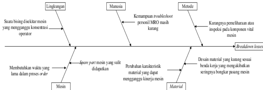
Gambar 2. Fishbone Diagram untuk faktor Breakdown Losses

Berdasarkan tabel diatas dapat diketahui bahwa kerugian dengan nilai tertinggi dari Five Big Losses pada mesin CNC Plano 133 dan Horizontal Milling 142 dalam periode Januari 2021 hingga Desember 2022 adalah breakdown losses dengan nilai masing-masing yaitu sebesar 8,66 % dan 9,54 %. Langkah selanjutnya untuk mengetahui penyebabnya breakdown losses adalah dengan mengidentifikasi faktor penyebabnya menggunakan fishbone analysis . Berikut ini diagram sebab akibat ( fishbone ) untuk faktor breakdown losses .