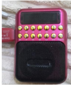
Gambar 2. Alat bantu media audio portable multimedia speaker

Perangkat yang biasa dipakai untuk membantu menghafalkan Al-quran dengan metode istima' dan tiktir adalah perangkat audio yang diputar menggunakan portable multimedia speaker yang berisikan rekaman ayat Alquran dan headset jika diperlukan untuk membantu menghafal Qur'an lebih berkonsentrasi mendengarkan setiap lafadz dari ayat yang hendak dihapalkan secara seksama. Ketika seorang murid ingin menghafal Qur'an namun sedang tidak bersama guru, alat ini bisa digunakan sebagai media pembantu. Speaker murottal dinyalakan agar menghafal mendengarkannya dengan perhatian khusus dan konsentrasi lalu mengikutinya perlahan dan diulangi sesuai kebutuhan. Kemudian jika dirasa sudah lancar, bisa dilanjutkan ke ayat selanjutnya, begitu juga seterusnya [32].