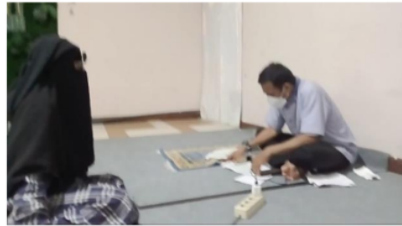
Gambar 3. Setoran Hafalan kepada Ahli