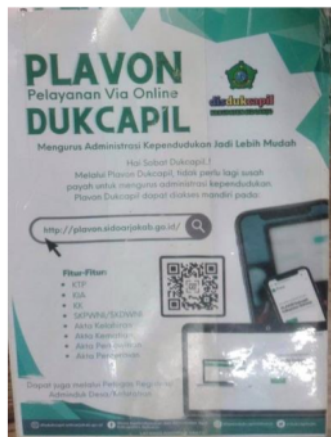
Gambar 2. Brosur Pelayanan Desa

terkait. Maka, setiap aparaturn pemerintah harus bisa melayani masyarakat maupun penerima pelayanan serta dapat mempelajari bagaimana upaya dalam meningkatkan keterampilan guna melayani masyarakat yang meliputi, kerapihan, kesopanan, dan cara berkomunikasi dengan baik. Di samping itu, dalam mewujudkan pelayanan yang baik dapat di dukung dengan adanya fasilitas pelayanan publik yang memadai. Hal-hal tersebut diharapkan dapat memberi kepuasan bagi warga yang menerima pelayanan publik. (Risna, 2018).