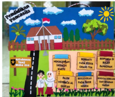
Gambar 3. Hasil Akhir Media Papan Flanel Berkarakter

Setelah tahap mendesain sudah selesai dibuat, Tahap berikutnya validasi ahli produk. Validasi ahli dilaksanakan dengan beberapa ahli yang berkemampuan dalam bidangnya agar dapat mengevaluasi produk yang baru dirancang oleh peneliti. Peneliti melakukan 2 ahli validator yaitu validasi ahli materi dan validasi ahli media. Sebelum melakukan validasi peneliti menyiapkan kisi-kisi instrumen yang sudah dibuat dan sudah direvisi sama dosen. Tujuan dari tahap validasi ini untuk mengetahui kelayakan media papan flanel tempel berkarakter (PAFTER). Pada tahap ini dilakukan beberapa kali validasi hingga media dikatakan layak untuk di uji cobakan ke siswa. Setelah tahapan validasi dilakukan oleh para ahlinya, selanjutnya hasil dari penilaian diuraikan dengan menetapkan rumus sebagai acuan dalam memvalidasi kepantasan media guna untuk mendapatkan nilai. Kemudian, hasil dari nilai yang didapatkan akan ditransformasikan pada panduan skala linkret untuk mendapatkan kualifikasi dan kepantasan dari media yang ditingkatkan. berikut ini yaitu hasil tanggapan dari beberapa ahli.