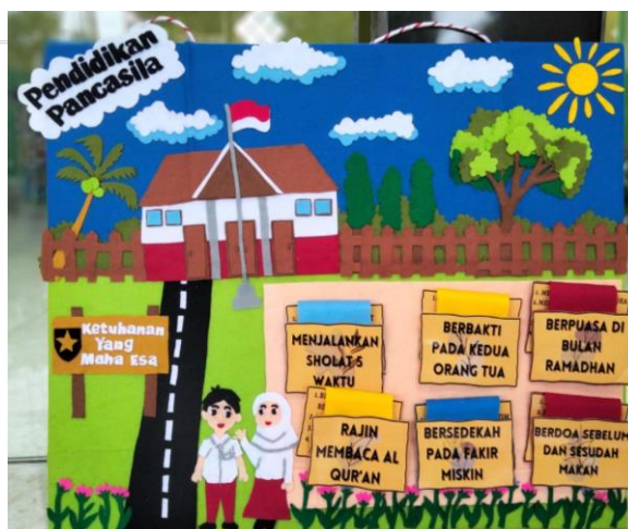
Gambar 3. Hasil Akhir Media Papan Flanel Berkarakter

Setelah tahap mendesain sudah selesai dibuat, Tahap berikutnya validasi ahli produk. Validasi ahli dilaksanakan dengan beberapa ahli yang berkemampuan dalam bidangnya agar dapat mengevaluasi produk yang baru dirancang oleh peneliti. Peneliti melakukan 2 ahli valiator yaitu validasi ahli materi dan validasi ahli media. Sebelum melakukan validasi peneliti menyiapkan kisi-kisi instrumen yang sudah dibuat dan sudah direvisi sama dosen. Tujuan dari tahap validasi ini untuk mengetahui kelayakan media papan flanel tempel berkarakter (PAFTER). Pada tahap ini dilakukan beberapa kali validasi hingga media dikatakan layak untuk di uji cobakan ke siswa. Setelah tahapan validasi dilakukan oleh para ahlinya, selanjutnya hasil dari penilai diuraikan dengan menetapkan rumus sebagai acuan dalam memvalidasi kepantasan media guna untuk mendapatkan nilai. Kemudian, hasil dari nilai yang didapatkan akan ditransformasikan pada panduan skala linkret untuk mendapatkan kualifikasi dan kepantasan dari media yang ditingkatkan. berikut ini yaitu hasil tanggapan dari beberapa ahli.