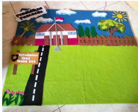
Gambar 2. Menempelan Hiasan