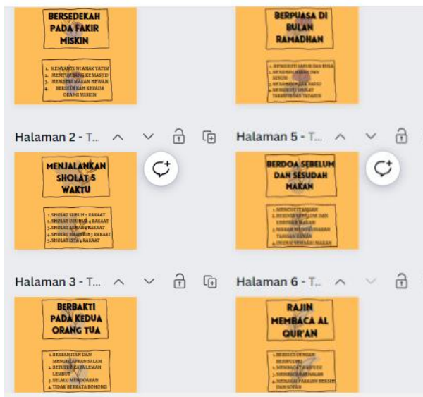
Gambar 1. Penyusunan Karakter Religius Sila Pertama