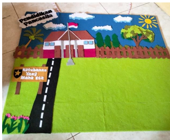
Gambar 2. Menempelkan Hiasan