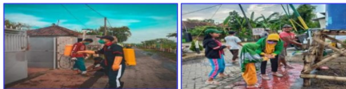
Gambar 3.1 : Posko Pencegahan Penyebaran COVID-19 di Dusun Cangkringan

Gambar tersebut merupakan potret Posko Pencegahan Penyebaran COVID-19 yang didirikan oleh warga Dusun Cangkringan atas dasar inisiatif warga setempat. Penjagaan di Posko dilakukan setiap hari oleh tim relawan yang merupakan warga Dusun Cangkringan selama 24 jam sebagaimana yang tertulis pada surat edaran ketua RW 03 Dusun Cangkringan.