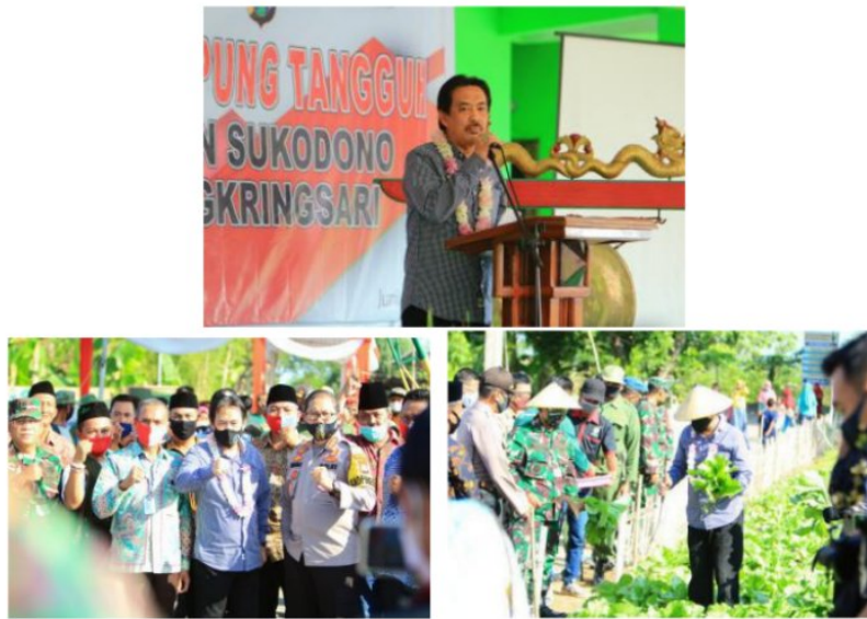
Gambar 3.2: Launching Kampung Tangguh di Dusun Cangkring yang diresmikan oleh Plt.Bupati Sidoarjo (Alm.Nur ahmad.)

Pada tanggal 27 Juni 2020 diadakan acara launching dimana Dusun Cangkring diresmikan oleh Pemerintah Kabupaten Sidoarjo sebagai Kampung Tangguh oleh Wakil Bupati Sidoarjo. Acara launching tersebut adalah acara peresmian kampung tangguh untuk seluruh kampung tangguh di wilayah Kecamatan Sukodono. Lokasi launching berada di Kampung Tangguh Dusun Cangkring.