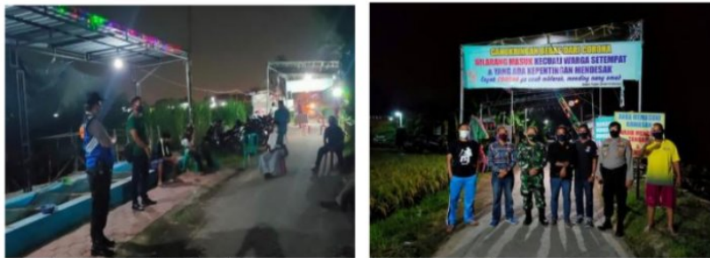
Gambar 3.3 : Sosialisasi ke warga yang melibatkan tokoh agama dan masyarakat

Proses kolaborasi dilakukan secara langsung oleh Ketua Koordinator Kampung Tangguh beserta Kepala Dusun yang kemudian menginformasikan secara langsung kepada masyarakat melalui sosialisasi ke warga yang melibatkan tokoh-tokoh agama dan masyarakat guna menginformasikan segala informasi berkaitan dengan program kampung tangguh, Adapun potretnya sebagai berikut: