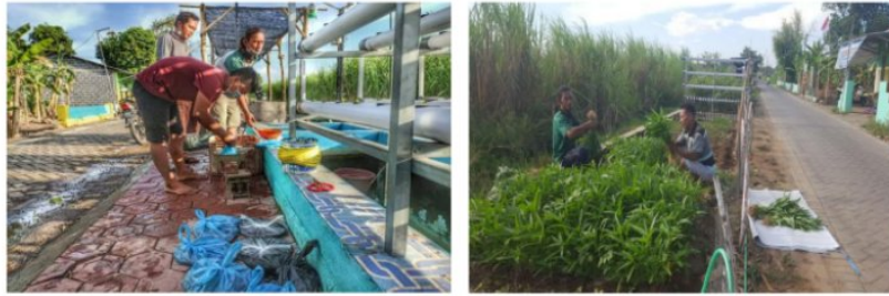
Gambar 3.4 : Ketahanan Pangan Kolam ikan Lele dan Lahan sayur-sayuran

Pada media publikasi, yakni Koran Radar Sidoarjo edisi tanggal 17 Juli 2020 dijelaskan bahwa Kampung Tangguh Dusun Cangkringan telah melaksanakan penjagaan Posko Kampung Tangguh dengan ketat selama 24 jam. Ketua RW 03 Dusun Cangkringan telah melakukan upaya sosialisasi kepada warga terkait tindakan yang harus dilakukan apabila terdapat warga yang terjangkit COVID-19 agar bisa ditangani bersama-sama. Selain itu juga kesiapan lumbung pangan di Dusun Cangkringan yang berupa beras yang dihimpun dari hasil panen warga setempat, budidaya ikan lele, dan tanaman sayur-sayuran yang semua itu dilakukan oleh tim relawan. Lumbung pangan dikelola secara mandiri merupakan langkah antisipasi jika terjadi krisis pangan akibat pandemi COVID-19.