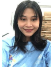
Gambar 1. Penggunaan instastory sebelum memakai filter