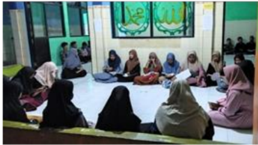
Gambar 2. Kegiatan Mabait (Malam Bina Iman dan Taqwa)

kontrol ibadah. Tak lupa sekolah tersebut menerapkan pembelajaran Diniyah usai pembelajaran. Diniyah dilaksanakan pada hari Rabu dan Kamis secara bergantian dengan materi tentang ilmu Hadis dan ilmu Fiqih. Disetiap hari Jum'at sekolah tersebut membiasakan untuk membaca QS. Al-Kahfi secara bersama-sama dan dipimpin melalui audio kelas pukul 07.00-07.30; Pembiasaan adalah salah satu teknik pendekatan pembentukan nilai untuk membiasakan diri dengan hal-hal yang positif sehingga pembiasaan menjadi kebiasaan (Wawancara, 08 Mei 2023).