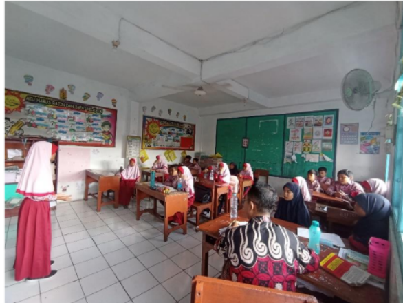
Gambar 2. Kegiatan ekstrakurikuler Da'i Cilik

Pelaksanaan kegiatan ekstrakurikuler Da'i cilik di SD Muhammadiyah 2 Waru terdiri dari beberapa tahapan. Pertama, siswa berkumpul disalah satu kelas yang menjadi tempat pelaksanaan kegiatan ekstrakurikuler. Kedua, pembina ekstrakurikuler membuka kegiatan ekstrakurikuler dengan menyampaikan salam dan berdoa. Ketiga, pembina menjelaskan terlebih dahulu materi apa yang akan disampaikan pada saat berdakwah. Keempat, penyampaian dakwah oleh siswa yang ditunjuk satu persatu oleh pembina. Kelima, pembina ekstrakurikuler memberikan ulasan kembali tentang penampilan dan isi materi yang disampaikan oleh peserta didik. Keenam, pembina ekstrakurikuler menutup kegiatan ekstrakurikuler dengan berdoa bersama.