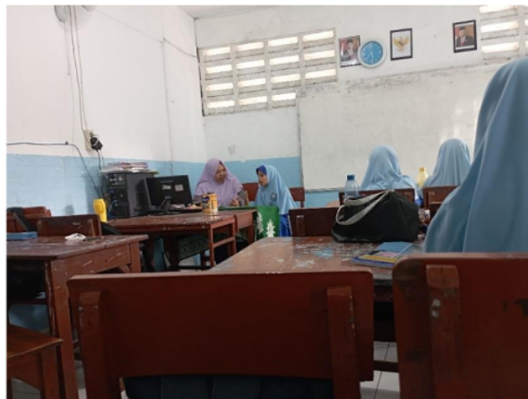
Gambar 3. Kegiatan Ekstrakurikuler BTQ

Kegiatan ekstrakurikuler BTQ di SD Muhammadiyah 2 Waru dilaksanakan satu minggu sekali. Kegiatan ini dilakukan disetiap hari senin 13.30 – 14.30. Kegiatan ekstrakurikuler ini di ikuti oleh peserta didik dari kelas 1 sampai kelas 6.