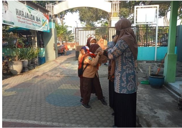
Gambar 3. Siswa memberi salam ke guru sebelum masuk ke kelas

Kegiatan pembiasaan yang lain adalah membaca doa sebelum makan saat jam istirahat dan membaca doa sesudah makan saat jam istirahat telah usai. Ketika berdoa siswa dibiasakan untuk berperilaku dan bersikap baik. Ada pula pembiasaan salat dhuha dan salatzuhur sesuai dengan waktu mata pelajaran Pendidikan Agama Islam (PAI). Waktu pembelajaran Pendidikan Agama Islam (PAI) siswa kelas 4 bertepatan pada hari Rabu. Salat dhuha akan dilaksanakan sebelum memulai kegiatan dan salatzuhur dilaksanakan ketika waktu salatzuhur yang bertepatan waktu akan pulang atau jam pelajaran habis. Pada hari senin dan selasa terdapat kegiatan ekstrakurikuler pada pukul 14.00. Guru kelas 4 membiasakan siswa kelas 4 untuk salatzuhur terlebih dahulu sebelum memulai kegiatan ekstrakurikuler.