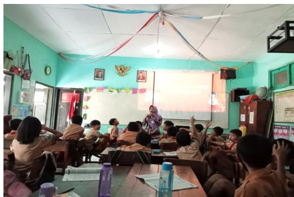
Gambar 2. Musyawarah kesepakatan kelas

Pertama, kegiatan kesepakatan kelas biasanya dilakukan ketika di awal masuk tahun ajaran sekolah. Apabila pada saat tertentu peraturan dapat ditambahkan oleh guru sesuai dengan situasi dan kondisi yang ada. Dalam manajemen kelas, guru memiliki wewenang untuk mengelola kelas baik fisik maupun non fisik [17]. Peraturan yang diusulkan oleh guru akan disepakati bersama antara guru dan siswa. Kesepakatan tersebut dilakukan melalui kegiatan musyawarah.