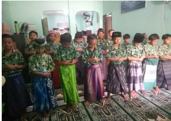
Gambar 4. Siswa melaksanakan salatzuhur pada saat jam pelajaran PAI

Kegiatan pembiasaan yang lain adalah membaca doa sebelum makan saat jam istirahat dan membaca doa sesudah makan saat jam istirahat telah usai. Ketika berdoa siswa dibiasakan untuk berperilaku dan bersikap baik. Ada pula pembiasaan salat dhuha dan salatzuhur sesuai dengan waktu mata pelajaran Pendidikan Agama Islam (PAI). Waktu pembelajaran Pendidikan Agama Islam (PAI) siswa kelas 4 bertepatan pada hari Rabu. Salat dhuha akan dilaksanakan sebelum memulai kegiatan dan salatzuhur dilaksanakan ketika waktu salatzuhur yang bertepatan waktu akan pulang atau jam pelajaran habis. Pada hari senin dan selasa terdapat kegiatan ekstrakurikuler pada pukul 14.00. Guru kelas 4 membiasakan siswa kelas 4 untuk salatzuhur terlebih dahulu sebelum memulai kegiatan ekstrakurikuler.