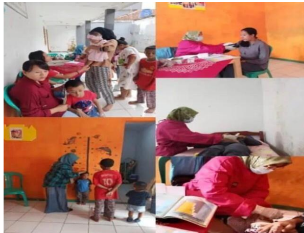
Gambar 4. Sarana dan Prasarana Ponkesdes Desa Bligo Kecamatan Candi Kabupaten Sidoarjo

"Sarana dan prasarana belum memadai karena ruangan untuk pemberian asi eksklusif tidak berfungsi dengan baik". (wawancara tanggal 4 Januari 2023)