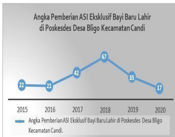
Gambar 2. Grafik Perkembangan Pemberian ASI Eksklusif Bayi di Desa Bligo Tahun 2015-2020

Berdasarkan data dari Kabupaten/Kota diketahui bahwa cakupan bayi yang mendapatkan ASI Eksklusif di Jawa Timur pada tahun 2018 sebesar 76,8%. Cakupan tersebut mengalami kenaikan dibandingkan dengan tahun-tahun sebelumnya. Kenaikan tersebut menunjukkan bahwa semakin meningkatnya pemahaman para ibu bayi tentang pentingnya ASI eksklusif bagi bayinya. Pemberian ASI Eksklusif pada bayi dan perkembangan gizi yang ada pada bayi tepatnya di lingkungan Desa Bligo Kecamatan Candi ini hanya ada beberapa yang tidak memberikan ASI eksklusif disebabkan diantaranya: 1) ibu yang sibuk bekerja, 2) ASI nya tidak keluar, 3) terjadinya penurunan gizi dan penurunan berat badan pada bayi, dan 4) sudah melampaui standart gizi yang dianjurkan. Berdasarkan data yang diterima dari Poskesdes Desa Bligo tentang perkembangan pemberian ASI eksklusif pada bayi di Desa Bligo tahun 2015-2020 yaitu pemberian ASI Eksklusif pada bayi di Desa Bligo masih belum sepenuhnya mengalami kenaikan. Justru malah mengalami penurunan.