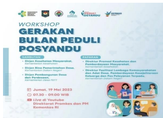
Gambar 3. Kegiatan Workshop Gerakan Bulan Peduli Posyandu Tahun 2023

Dari Gambar di atas dapat dilihat mengenai informasi terkait pemberian ASI eksklusif dinas kesehatan RI dan dinas kesehatan kemudian Ponkesdes Desa Bligo Kec.Candi telah menyampaikan kepada ibu menyusui terkait informasi tersebut juga dapat diakses di youtube tanpa datang langsung ke ponkesdes Desa Bligo Kec.Candi agar nantinya ibu menyusui mendapatkan banyak informasi terkait pemberian ASI eksklusif. Hal ini dapat dilihat juga dari pernyataan ibu budi selaku Kader Posyandu Pos 1 sebagai berikut: