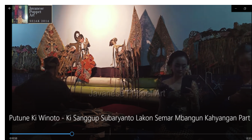
Gambar 3.

Tokoh puntadewa sebagai pemimpin secara tidak langsung memiliki sikap ramah. Sifat ramah tamah seorang pemimpin dalam menyambut hangat tamunya merupakan tindakan moral yang dilakukan dengan semestinya. Dalam [8] tindakan Punta dewa termasuk dalam moral Praiseworthy yaitu tindakan baik tanpa motif tertentu yang muncul atas kesadaran dalam dirinya.