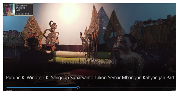
Gambar 5.

Karya seni pagelaran wayang kulit nempakan nilai estetikanya melalui perpaduan kerjasama antara dalang, pengrawit (penabuh gamelan) dan sinden hingga menciptakan sebuah tontonan seni pertunjukan bagi masyarakat.