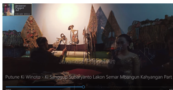
Gambar 6.

Tokoh tokoh dari pandawa lima dikenal sebagai ksatria yang melawan kebatilan dan memiliki karakter yang bertanggung jawab dan suka menolong sehingga dapat dicontoh umat manusia, dari sifat tersebut termasuk praiseworthy dalam nilai moral immanuel kant.