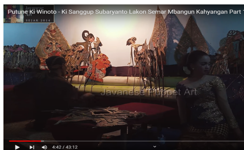
Gambar 2.

Dalam penelitian ini peneliti hanya akan melakukan observasi pada channel Youtube Javanese Puppet Art dengan video yang berjudul “Putune Ki Winoto – Ki Sanggup Subaryanto Lakon Semar Mbangun Kahyangan Part 1”, dengan pertimbangan bahwa video tersebut telah ditonton sebanyak 1,4 ribu penonton, sehingga peneliti ingin mencari tahu tentang nilai-nilai yang termuat dalam cerita tersebut. Karena dengan nilai penonton yang sebanyak itu apakah para penonton wayang kulit tersebut dapat mengerti semua tentang nilai-nilai yang disampaikan oleh dalang sebagai sutradara sekaligus memainkan gerakan peraga tokoh wayang yang ditampilkan.