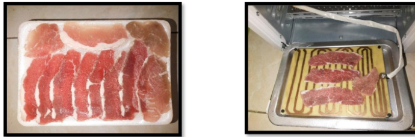
Gambar 3. Irisan Daging Sapi Sebelum Di Keringkan

Dalam pengujian yang dilakukan, didapatkan data untuk kondisi daging sapi sebelum dikeringkan dan setelah dikeringkan menggunakan mesin pengering dendeng sapi. Hasil pengujian kondisi basah dan kering dendeng sapi seperti ditunjukkan dalam gambar berikut.