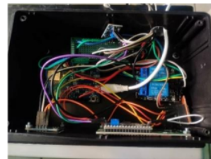
Gambar 2. Alat Pengering Dendeng Sapi