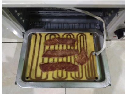
Gambar 4. Dendeng Sapi Yang Sudah Di Keringkan

Pengujian bahan dengan menggunakan alat pengering dendeng sapi, yang juga dilakukan sebanyak enam kali percobaan dengan pembagian waktu setiap 10 menit sekali selama 60 menit. Bisa didapatkan bahwa daging sapi yang dikeringkan dengan alat pengering dendeng sapi mengalami penurunan kadar air setiap 10 menit. Pada 10 menit pertama, suhu yang terbaca adalah 55,50 °C dan kadar air pada dendeng sapi adalah 70% sehingga bisa disebut kalau dendeng sapi termasuk masih basah. Lalu pada 20 menit percobaan suhu berada pada angka 58,50 °C dan kadar air dendeng sapi menurun menjadi 63%. Pada 30 menit percobaan suhu menjadi 58,90 °C dengan kadar air menjadi 58%.