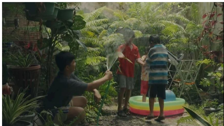
Gambar 3. 3