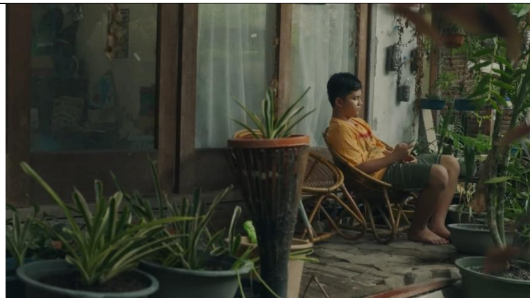
Gambar 3. 1