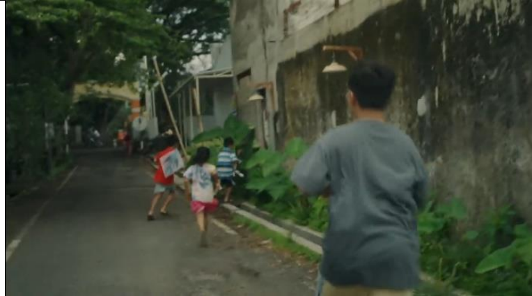
Gambar 3. 2