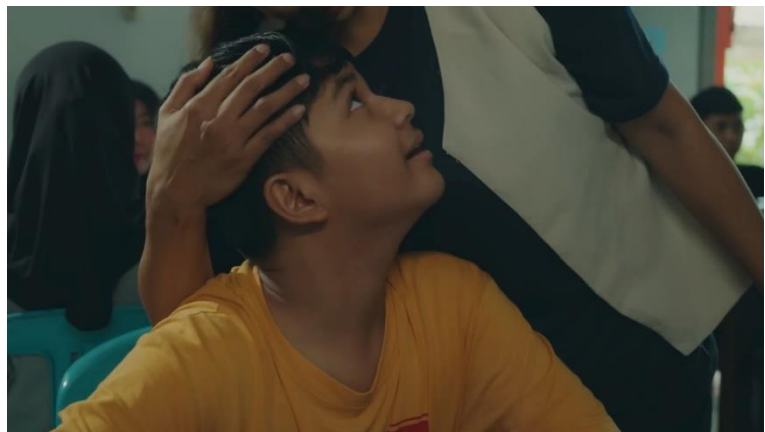
Gambar 3. 8