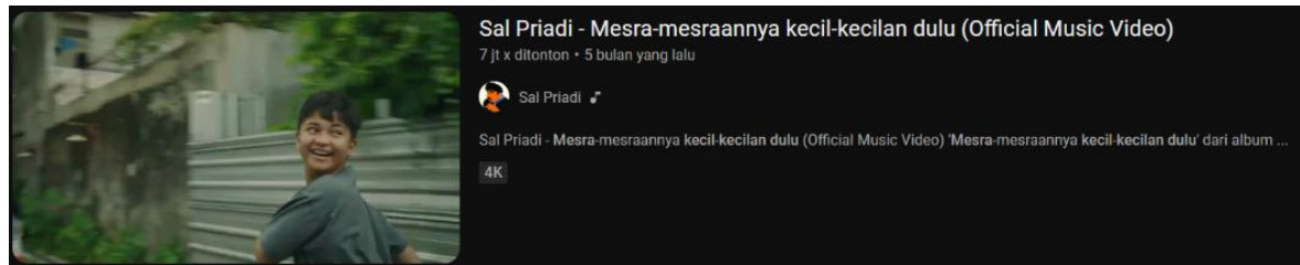
Gambar 1. Thumbnail Video Klip "Mesra-Mesraannya Kecil-Kecilan Dulu"

oleh instrumentasi megah. Banyak diantaranya karya lagu Sal Priadi sering didengar karena telah berhasil membawakan konsep lirik dan video klip yang telah mewakili setiap emosional manusia.