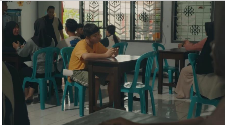
Gambar 3. 7