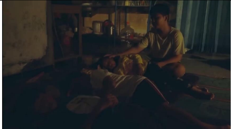
Gambar 3. 4