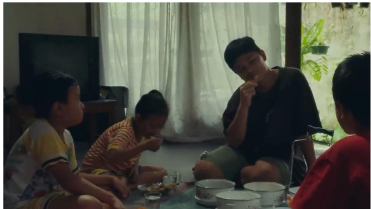
Gambar 3. 5