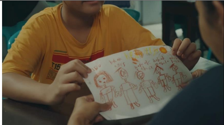
Gambar 3. 6