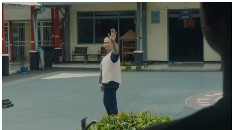
Gambar 3. 9