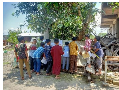
Gambar 4. Proses pembelajaran di Halaman Sekolah

Berdasarkan hasil penelitian yang dilaksanakan peneliti di SD Alam Al-Izzah Krian dengan implementasi guru dalam melakukan pemanfaatan lingkungan sekolah untuk meningkatkan motivasi belajar siswa kelas V SD Alam Al-Izzah Krian. Lingkungan sekolah mampu memberikan kesan baik pada kegiatan pembelajaran seperti siswa menjadi antusias serta merasa senang serta tertarik untuk mengikuti proses pembelajaran. Pemanfaatan lingkungan sekolah oleh guru di SD Alam Al-Izzah Krian mampu meningkatkan motivasi belajar siswa hal itu terlihat dari respon angket jawaban siswa. Hasil dari kuesioner atau angket siswa rata-rata sebesar 80 % dengan kriteria baik, para siswa semangat dalam belajar karena guru melakukan proses pembelajaran dengan memanfaatkan lingkungan sekolah. Selain itu juga motivasi siswa menjadi meningkat terlihat dari keaktifan mereka saat proses pembelajaran pembelajaran berlangsung, banyak para siswa yang aktif bertanya kepada guru ketika kurang memahami materi serta aktif menjawab pertanyaan yang diajukan oleh guru. Hasil data lainya berupa observasi tentang implementasi pemanfaatan lingkungan sekolah