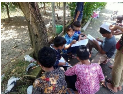
Gambar 3. Proses pembelajaran di Mini Zoo