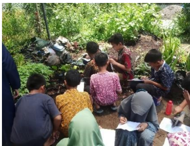
Gambar 1. Proses Pembelajaran di Taman

Proses pembelajaran untuk materi ekosistem dilakukan di lingkungan sekolah. Sebelum memulai proses pembelajaran di luar kelas, para siswa di briefing terlebih dahulu mengenai pelajaran yang akan dipelajari hari ini kemudian guru membagikan lembar kerja kepada para siswa. Proses pembelajaran dilakukan di taman, kolam ikan dan mini zoo, berikut ini hasil dokumentasi saat proses pembelajaran di lingkungan sekolah: