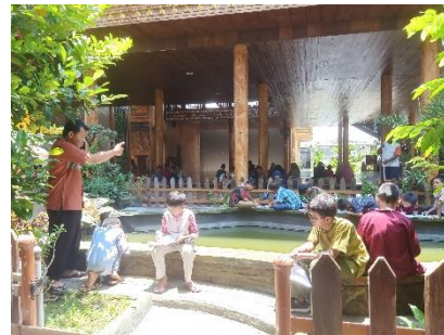
Gambar 2. Proses pembelajaran di Kolam Ikan