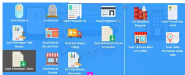
Gambar 1. Pelayanan Program SIPRAJA Tipe A, B, C