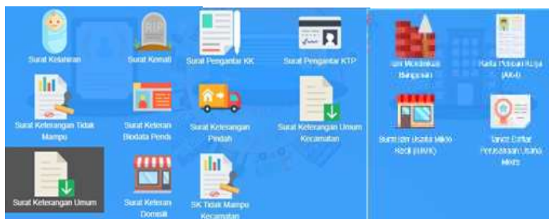
Gambar 1. Pelayanan Program SIPRAJA Tipe A, B, C