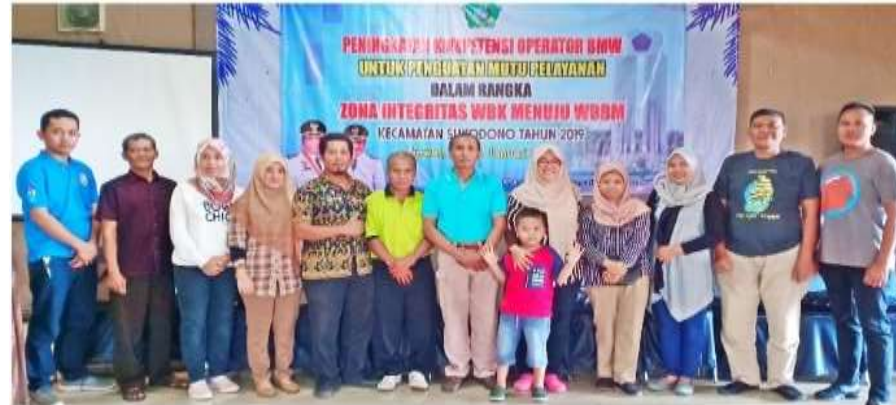
Kegiatan Peningkatan Kompetensi Operator BMW Kecamatan Sukodono untuk Penguatan Mutu Pelayanan dalam Rangka ZI menuju WBK/WBBM