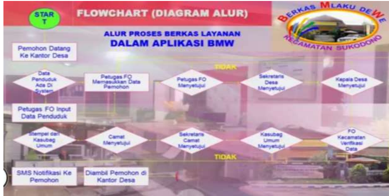
Gambar 2. Alur Proses Berkas Layanan Pada Aplikasi Berkas Mlaku Dewe