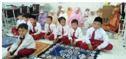
Gambar 8. Dzikir bersama

Nilai karakter religius pada pembiasaan sholat dzuhur berjamaah ialah taat dan patuh terhadap perintah Allah SWT dengan menjalankan ibadah sholat fardhu. Sholat merupakan salah satu rukun islam yang harus dilaksanakan, karena sholat merupakan tiang agama umat islam. Jika sholatnya seseorang baik maka amal ibadah lainnya juga baik, sebaliknya jika sholatnya seseorang buruk maka amal ibadah lainnya juga buruk.