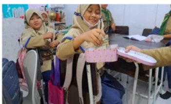
Gambar 9. Infak Hari Jum'at

Pembiasaan infak ini dilakukan pada hari jum'at di saat sebelum memulai pembelajaran. Pelaksanaan infak dilakukan siswa dengan sendirinya tanpa menunggu perintah dari guru, ada satu siswa yang menghendle dalam menarik infak kemudian infak yang terkumpul diberikan kepada guru untuk disetorkan ke sekolah. Infak tidak ada ketentuan dalam jumlah nominal yang harus dikeluarkan, siswa melakukan infak dengan semampu dan seikhlasnya tanpa ada paksaan dari siapapun. Nilai karakter religius dalam pembiasaan ini ialah taat dan patuh kepada perintah Allah SWT dan ikhlas mengeluarkan sebagian hartanya untuk kesejahteraan umat.