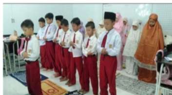
Gambar 6. Sholat Dzuhur Berjamaah

Pembiasaan sholat dzuhur dilakukan di ruang kelas masing-masing dengan berjamaah bersama teman sekelas. Sholat dzuhur berjamaah dilakukan pada saat jam istirahat kedua dengan dipimpin oleh siswa yang jadwalnya menjadi imam sholat, jadwal imam sholat dan mudzin digilir setiap harinya. Apabila siswa tidak masuk saat jadwal menjadi imam maka siswa yang lain langsung menggantikan teman tersebut.