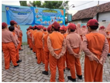
Gambar 1. Pembiasaan pagi

Pembiasaan pagi merupakan kebiasaan rutin yang dilakukan dalam lembaga pendidikan yang diajarkan dan ditanamkan secara rutin dan terus menerus pada perilaku atau tingkah laku peserta didik guna membentuk karakter peserta didik. Pembiasaan pagi yang diterapkan Sekolah Dasar Muhammadiyah 9 ngaban ini dengan mengumpulkan siswa di halaman sekolah untuk melakukan kegiatan pembiasaan pagi yang telah terjadwal.