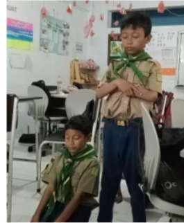
Gambar 5. Sholat Dhuha

Pembiasaan sholat dhuha dilakukan peserta didik pada saat jam istirahat pertama, pada saat pelaksanaannya peserta didik secara sadar dan bergegas mengambil air wudhu dan langsung sholat tanpa menunggu perintah dari guru. Adanya pembiasaan sholat dhuha ini memberikan pengaruh positif kepada peserta didik, selain terbiasa sholat dhuha di sekolah ada beberapa peserta didik yang melakukannya di rumah sebelum berangkat sekolah. Nilai karakter religius dalam sholat dhuha adalah patuh dan taat dalam melaksanakan perintah Allah SWT melalui ibadah sunnahnya yaitu sholat dhuha.