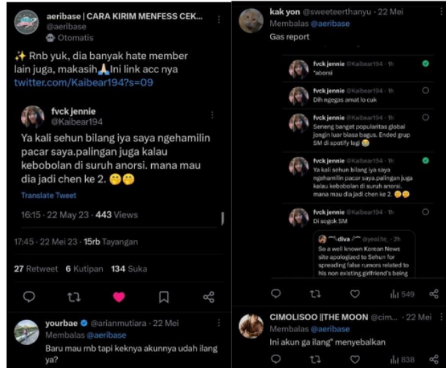
Gambar 3. Postingan @aeribase terkait akun solo stan

Dengan menyebarkan komentar negatif tersebut, dapat memunculkan kontravensi yang terjadi antar sesama penggemar yang dapat menimbulkan ketegangan dalam berinteraksi. Padahal kontravensi ini muncul bukan dari fandom tetapi dari pihak luar fandom dan juga solo stan yang ingin memecah belah fandom tersebut. Dengan munculnya berita dan komentar jahat yang tersebar, penggemar bisa melaporkan postingan tersebut di base khusus fandom EXO-L dan para penggemar akan me-report akun tersebut.