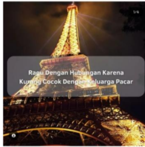
Gambar 3. Konten Akun @cerminlelaki