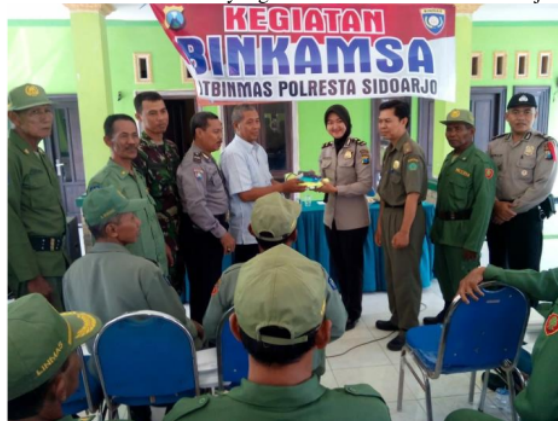
Gambar 2. Sosialisasi yang diadakan oleh Polresta Sidoarjo

Peran penting untuk meningkatkan kapasitas anggota satuan perlindungan masyarakat melalui program perlindungan masyarakat yang disediakan oleh Satuan Polisi Pamong Praja dengan dilakukannya sosialisasi kepada aparatur sipil negara yang berada di kecamatan dan desa di Kabupaten Sidoarjo yang bertujuan memberi pemahaman terkait fungsi perlindungan masyarakat dan satuan perlindungan masyarakat dalam menciptakan keamanan, ketentraman dan ketertiban. Sosialisai yang adakan tidak hanya berasal dari satu instansi yakni Satuan Polisi Pamong Praja, akan tetapi diberikan juga oleh instansi yakni TNI dan Polri.