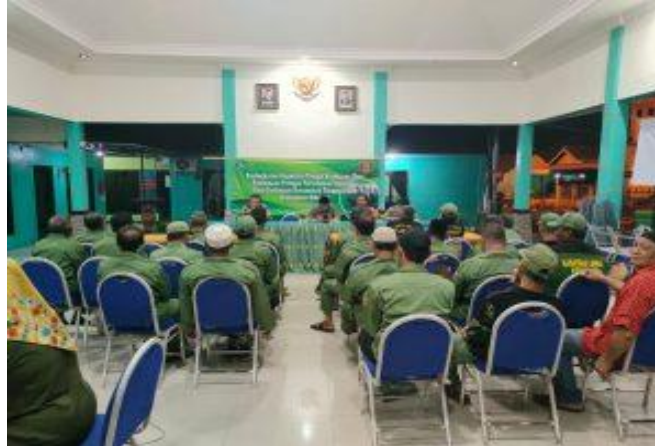
Gambar 3. Pembekalan dan pelatihan baris berbaris bagi satlinmas

Peningkatan keterampilan memiliki banyak manfaat bagi satuan perlindungan masyarakat untuk mengembangkan potensi yang dimiliki, sehingga dapat bermanfaat dengan baik. Penyelenggaraan keamanan, ketentraman dan ketertiban serta perlindungan masyarakat. Kegiatan pelatihan merupakan program yang diselenggarakan oleh Satuan Polisi Pamong Praja melalui bidang Linmas. Program ini diadakan dengan tujuan sebagai peningkatan kinerja kapasitas satuan perlindungan masyarakat. Wilayah Kabupaten Sidoarjo sendiri pelatihan yang diberikan seperti peraturan baris berbaris, pelaksanaan piket jaga atau sistem keamanan lingkungan, dan fungsi linmas lainnya.