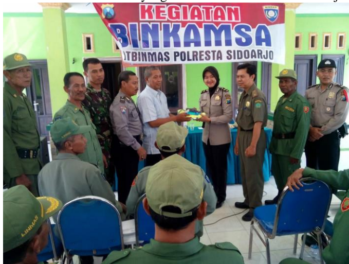
Sumber:Kodim 0816 Sidoarjo