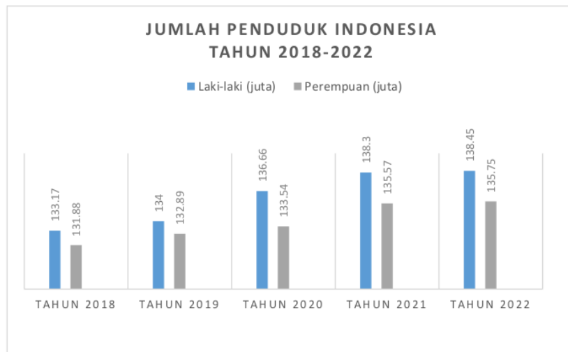
Gambar 1. Jumlah penduduk Indonesia menurut jenis kelamin pada tahun 2018-2022

Berdasarkan pencarian data jumlah penduduk Indonesia yang sesuai dengan gender atau jenis kelamin dapat dilihat dari table berikut :