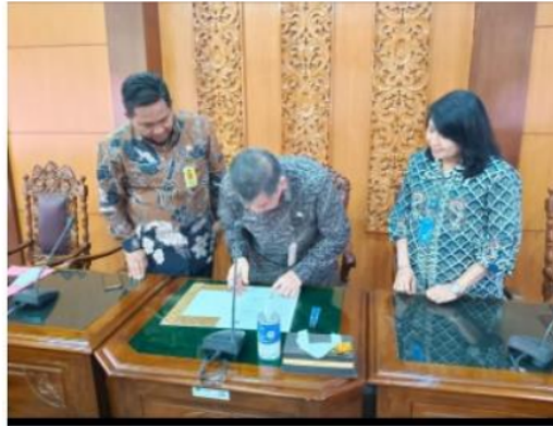
Gambar 2. Penandatanganan MOU

Pengarusutamaan Gender (PUG) bukanlah suatu program atau kegiatan melainkan suatu strategi pembangunan untuk mencapai suatu keadilan dan kesetaraan. Oleh sebab itu dukungan SDM harus memadai agar PUG dapat lebih konkrit baik pada perencanaan maupun penganggarannya. Kondisi daerah baik di provinsi maupun di kabupaten kota saat ini mengalami perubahan yang luar biasa dengan perubahan tugas pokok dan fungsi yang ada di masing-masing OPD. Tentu saja hal ini bisa menjadi kendala dalam pelaksanaan PUG dan memerlukan pencerahan terus menerus di berbagai tingkatan.