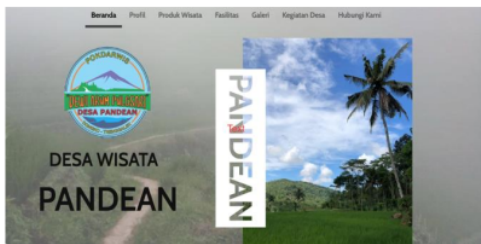
Gambar website desa wisata pandean

Strategi komunikasi yang dibangun oleh Pokdarwis dalam melakukan village branding dengan menggunakan perkembangan teknologi new media. Dunia digital antara lain Website, media social seperti Instagram, dan youtube. Selain dengan teknologi desa wisata Pandean juga bekerja sama dalam event. dengan pemerintah kabupaten trenggalek maupun dari pihak Perguruan tinggi yang ada di jawa timur.