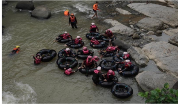
Gambar river tubing, desa wisata Pandean

berdasarkan hasil wawancara dengan Ketua Pokdarwis dewi arum Ibu Ririn Setyo Widiyastutik menjelaskan bahwa Desa Wisata Pandean menyediakan berbagai paket wisata yang dapat ditawarkan kepada wisatawan yakni Paket River Camp, Paket Dewi, Paket Arum, dan Paket Jadul Ayu. Aktivitas tersebut seperti pertanian, peternakan, UMKM, dan kesenian yang terdapat di Desa Pandean. Salah satunya paket River Camp merupakan keunggulan Desa Wisata Pandean dengan menawarkan destinasi wisata memperlihatkan kemegahan tatanan alamnya, dengan dihiasi pegunungan serta sungai alami yang mengalir mengikuti desa.