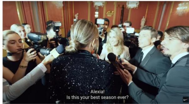
Gambar 3. Cuplikan Iklan Kampanye “Never Settle, Never Done”