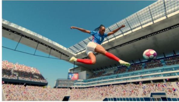
Gambar 6. Cuplikan Iklan Kampanye "Never Settle, Never Done"

Makna Denotasi : Denotasi yang terdapat dalam gambar 6 terlihat seorang atlet sepak bola perempuan yang sedang menendang bola dengan berlatar belakang di sebuah stadion sepak bola yang dipenuhi banyak orang disetiap sudutnya.