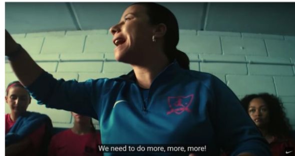
Gambar 2. Cuplikan Iklan Kampanye "Never Settle, Never Done"

"Saya berharap sepak bola perempuan menjadi global karena tidak ada lagi tabu yang mengelilinginya. Stereotip bahwa anak laki-laki harus bermain sepak bola dan anak perempuan melakukan senam sudah berlalu. Sekarang norma telah berubah, dan segalanya mungkin menjadi setara" Amandine Henry [25].