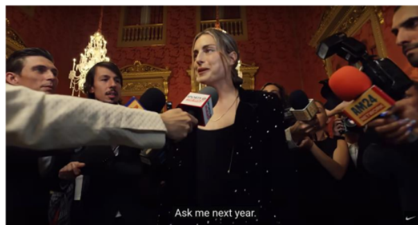
Gambar 4. Cuplikan Iklan Kampanye “Never Settle, Never Done”

Makna Denotasi : Denotasi yang terdapat dalam gambar 3 dan 4 terlihat banyak wartawan media dan satu orang menjadi pusat perhatian yang diliput dengan cara memotret dan merekam serta menyodorkan mic ke arah perempuan berbaju hitam tersebut.