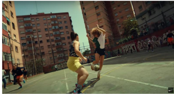
Gambar 1. Cuplikan Iklan Kampanye “Never Settle, Never Done”

Dalam iklan Nike Never Settle, Never Done yang saat ini masih tayang di media online YouTube, peneliti membagi beberapa adegan yang memiliki makna kuat dalam menyampaikan pesan yang ingin disampaikan oleh iklan tersebut dengan menggunakan teori semiotika Roland Barthes, dimana dalam semiotika model Roland Barthes berfokus pada aspek non verbal seperti cultural meaning dan visual sign , dalam semiotika Roland Barthes menjelaskan ada tiga tingkatan tahapan penandaan yang memungkinkan dihasilkannya makna dan pesan, yaitu tingkatan denotasi, konotasi dan mitos.