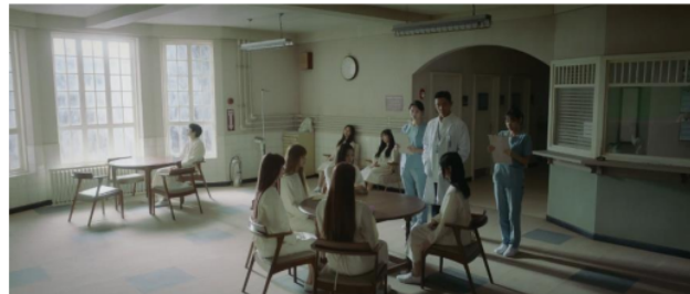
Gambar 4. Scene 1 shot 12 MV New Jeans "OMG"