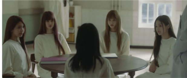
Gambar 2. Scene 1 Shot 1 MV New Jeans "OMG"