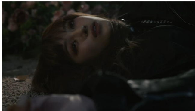
Gambar 10. Scene 9 shot 9 MV New Jeans "OMG"

Scene 9 shot 1 (02:37-02:42), 8 (03:15-03:16), 9 (03:19-03:23)