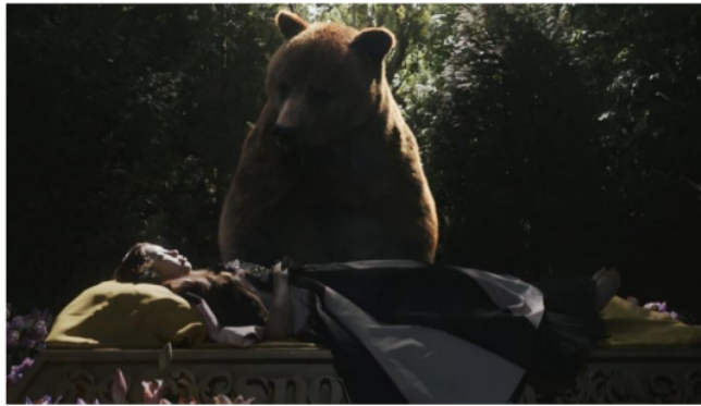
Gambar 9. Scene 9 shot 8 MV New Jeans "OMG"