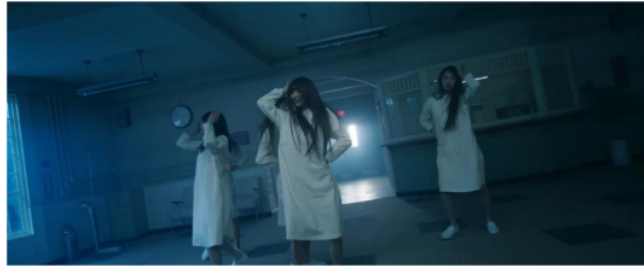
Gambar 5. Scene 1 shot 32 MV New Jeans "OMG"

Scene 1 Shot 4 (00:09-00:11), 6 (00:39-00:43), 12 (01:35-01:38), 32 (02:33-02:35)