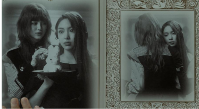
Gambar 8. Scene 9 shot 1 MV New Jeans "OMG"