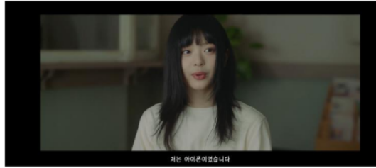
Gambar 6. Scene 2 shot 6 MV New Jeans "OMG"