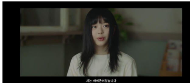
Gambar 3. Scene 1 shot 6 MV New Jeans "OMG"